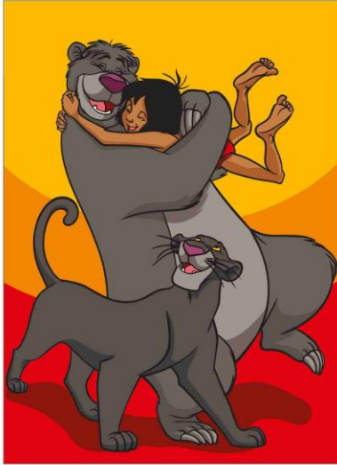
29 DAS Dschungelbuch