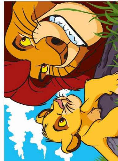
27 DER KÖNIG DER LÖWEN