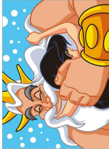
30 ARIELLE, DIE MEERJUNGFRAU