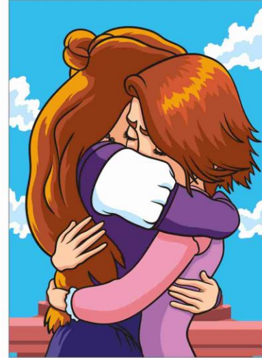
25 RAPUNZEL - NEU VERFÜHRT