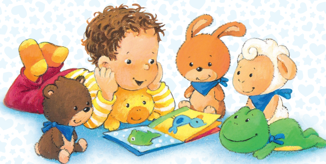
Illustration: Katja Senner • Text: Sandra Grimm

Liebevolle Reime und kurze Vorlesegeschichten zur guten Nacht sind eine wunderbare Ergänzung für das Abendritual.