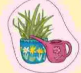
Pflanze und Gießkanne